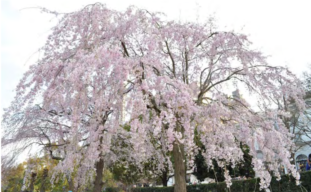
写真は4月2日山下公園（横浜市中区）にて撮影