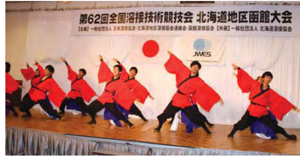
「よさこいソーラン」の演舞