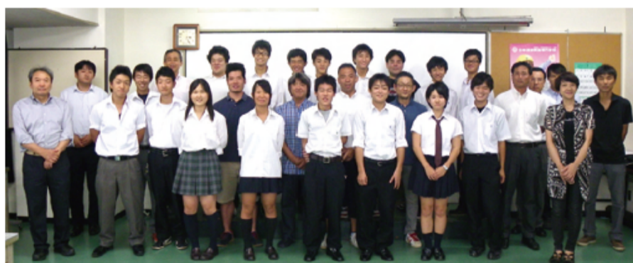
研修後の記念写真

尚、8月22日には(一財)日本溶接技術センター及びその他の団体共催で「非破壊検査セミナー」を開催した。最後に3日間の実習に於いて溶接した参加者各自の試験材を蛍光探傷試験及びエックス線透過試験したものを専門家の解説を受けながら溶接部の観察をした。