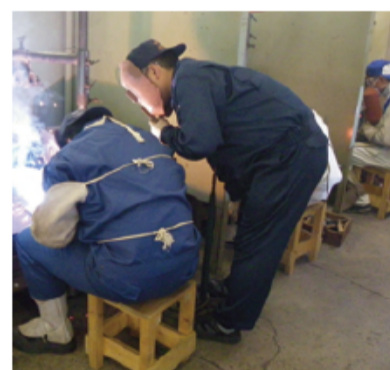
研修中の生徒と指導する先生