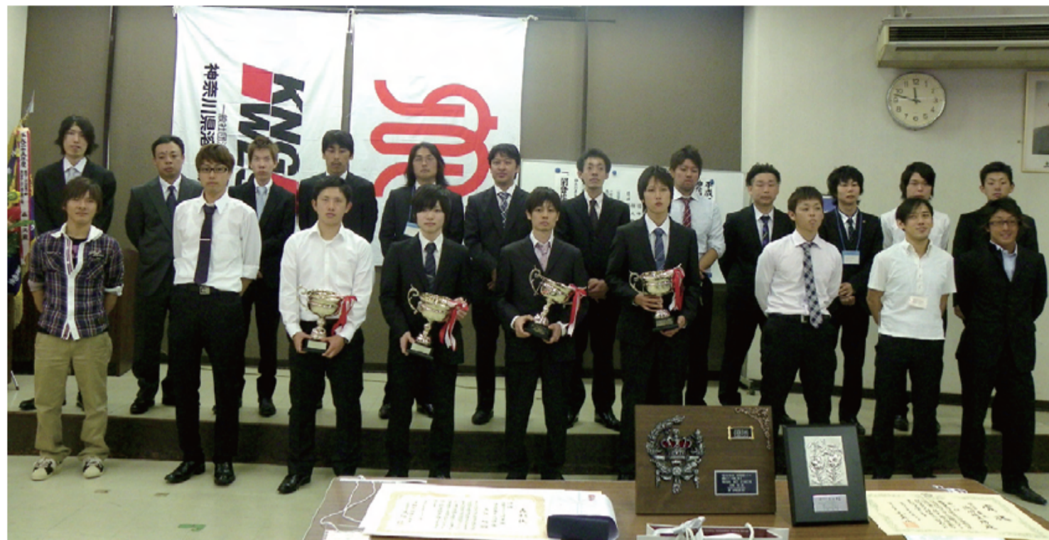
平成25年度(第56回)神奈川県溶接技術コンクール表彰式・優勝者を囲んで